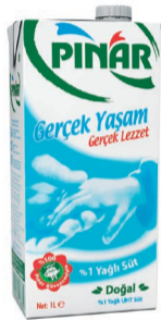
%1 Yađlı Süt 1 L