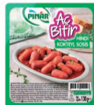
Aç Bitir Lokmalık Sosis 130 g