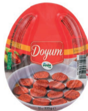
Doyum Sucuk 225 g TFE