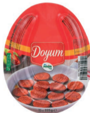
Doyum Sucuk 225 g