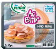
Aç Bitir Büyük Dilim Hindi Füme 60 g