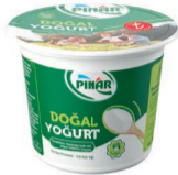
Doğal Yoğurt 500 g TFE