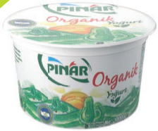
Organik Yoğurt 1000 g