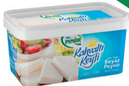
Kahvaltı Keyfi Beyaz Peynir 800 g