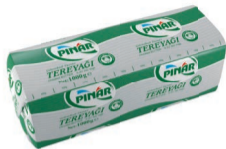
Tereyağı 1 kg (Opak Folyo)