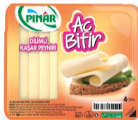
Aç Bitir Dilimli Kaşar 60 g TFE