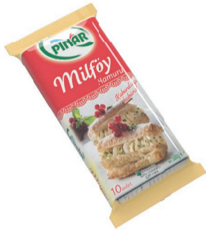
Milföy 500 g