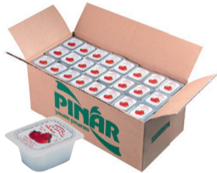
Gurme Reçel Çilek 20 g (144'lü)