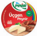
Üçgen Peynir 8 x 12,5 g TFE