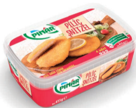
Piliç Snitzel 415 g