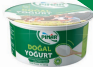
Kaymaksız Yoğurt 750 g