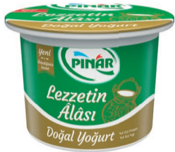
Lezzetin Alası Doğal Yoğurt 500 g