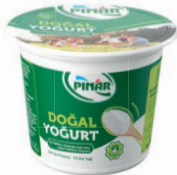
Kaymaksız Yoğurt 500 g