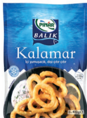
Halka Kalamar 400 g