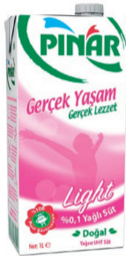
Extra Light Süt 1 L