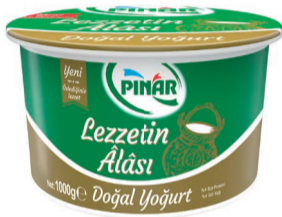
Lezzetin Alası Doğal Yoğurt 1000 g