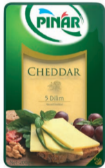
Cheddar Dilimli 200 g