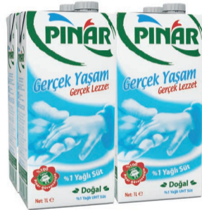
%1 Yađlı Süt 4 x 1 L