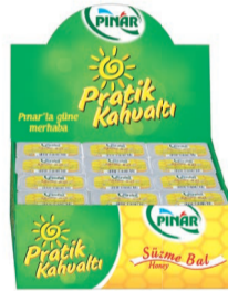
Bal Çiçek Pratik Kahvaltı 36 x 20 g