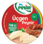
Üçgen Peynir 16 x 12,5 g