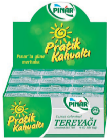
Tereyağı 15 g (36'lı)