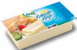
Kahvaltılık Keyfi Tost Peyniri 600 g