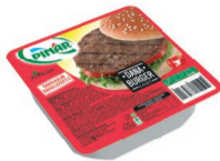
Pinar Burger 225 g