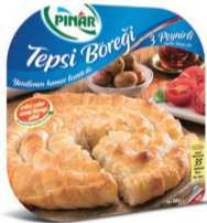
3 Peynirli Tepsi Böreği 400 g