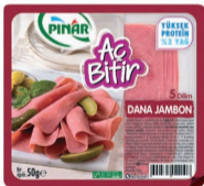
Aç Bitir Dana Jambon 50 g