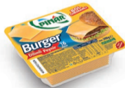
Burger Dilimli Peynir 200 g