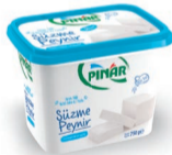
Süzme Peynir Yarım Yağlı 750 g