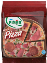
5'li Eko Pizza Promosyon 800 g