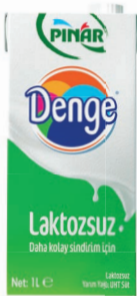
Denge Laktosuz Süt 1L