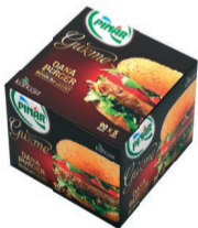
Gurme Burger 450 g