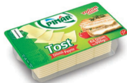
Dilimli Tost Peyniri 500 g