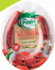
Klasik Kangal Sucuk 225 g