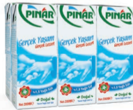
%1,5 Yarım Yağlı Süt 6 x 200 ml