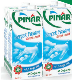
%1,5 Yarım Yağlı Süt 4 x 1 L