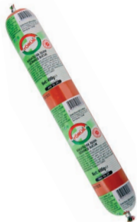
Yörük Sucuk 400 g