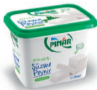
Süzme Peynir 750 g