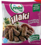
İnegöl Köfte 390 g