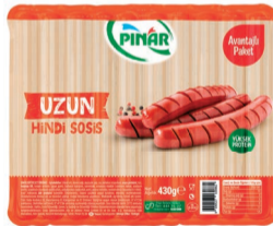
Ekonomik Hindi Uzun Sosis 430 g