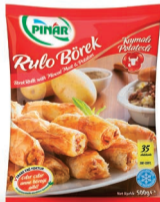
Kıymalı-Patatesli Rulo Börek 500 g