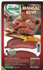
Mangal Keyfi Acılı 300 g