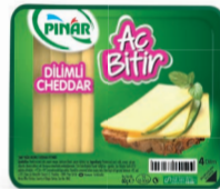
Aç Bitir Dilimli Cheddar 60 g TFE