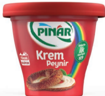
Krem Peynir 300 g