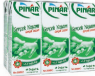
Tam Yağlı Süt 6 x 200 ml