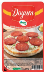
Doyum Dilimli Hindi I.İ.G. Sucuk 250 g