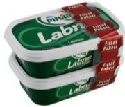
Labne 2x400 g