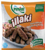
Tekirdağ Köfte 390 g