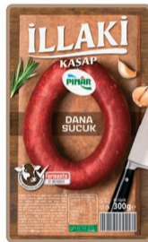
İllaki Dana Kasap Sucuk 300 g