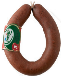
Aık Kungul Sucuk 3 x 350 g