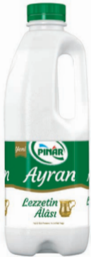
Lezzetin Alası Ayran 1 L