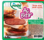
Aç Bitir Dilimli Hindi I.İ.G.Sucuk 80 g