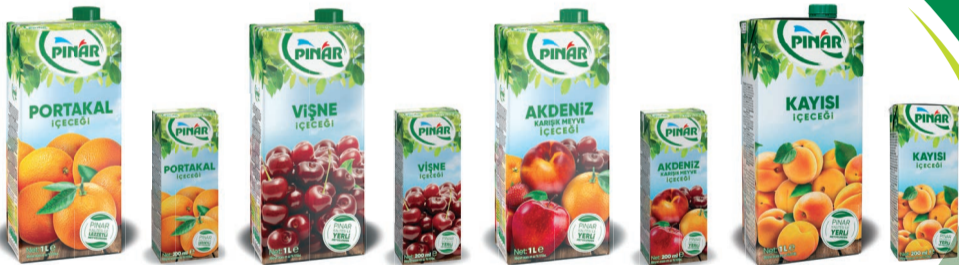
Meyveli İçecek Meyveli İçecek Meyveli İçecek Meyveli İçecek Meyveli İçecek Meyveli İçecek Meyveli İçecek Meyveli İçecek Portakal Portakal Vişne Vişne Akdeniz Akdeniz Kayısı Kayısı 1 L 200 ml 1 L 200 ml 1 L 200 ml 1 L 200 ml