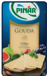
Gouda Dilimli 200 g