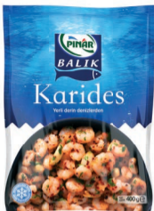
Karides 400 g