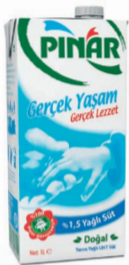
%1,5 Yarım Yağlı Süt 1 L