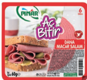
Aç Bitir Büyük Dilim Macar Salam 60 g