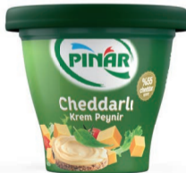
Cheddarlı Krem Peynir 270 g