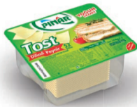
Dilimli Tost Peyniri 350 g