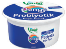
Denge Probiyotik Yoğurt 750 g