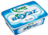
Pınar Beyaz 180 g