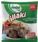
Akçaabat Köfte 400 g