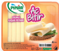
Aç Bitir Dilimli Kaşar 60 g