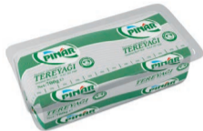
Tereyağı 700 g (Opak Folyo)