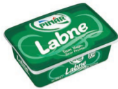
Labne 180 g TFE