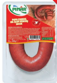
Dana Kungul Isıl İřlem Grmuř Sucuk 300 g