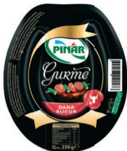
Gurme Kangal Sucuk 250 g