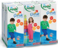
Çocuk Devam Sütü 6 x 200 ml