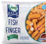
Fish Finger 240 g