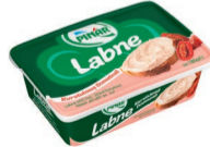
Labne Kurutulmuş Domatesli 180 g