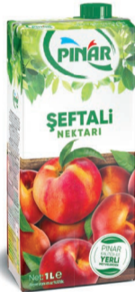
Meyve Nektarı Şeftali 1 L