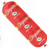
Doyum Hindi Salam 500 g