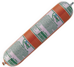
Büfe Hindi Salam 900 g