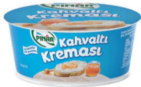
Pinar Kahvaltı Kreması 160 g