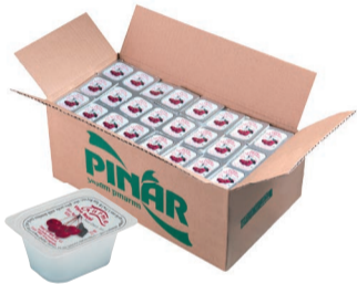
Gurme Reçel Vişne 20 g (144'lü)