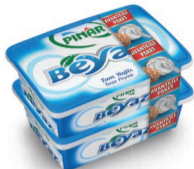
Pınar Beyaz 2x180 g (Avantaj Paket)