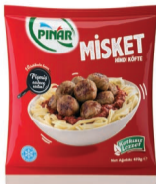
Misket Köfte 470 g