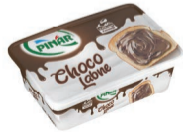
Choco Labne 180 g