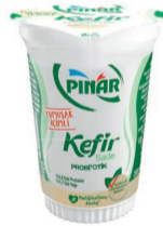
Bardak Kefir 200 ml