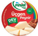
Üçgen Peynir 8 x 25 g