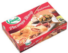
Paçanga Böreği 270 g