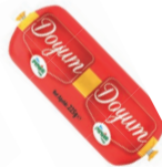
Doyum Hindi Salam 225 g