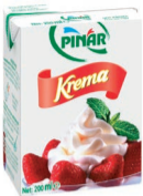
Krema 200 ml