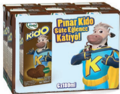
Kido Kakaolu Süt 6 x 180 ml