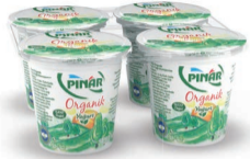
Organik Yoğurt 4 x 125 g