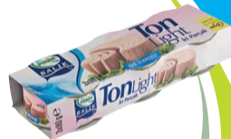
Light Ton Balık 3 x 80 g