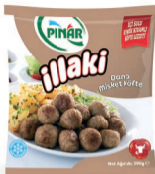
Dana Misket Köfte 390 g