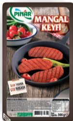
Mangal Keyfi 300 g