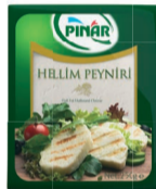
Hellim Peyniri 250 g