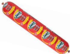
Macar Salam 1000 g