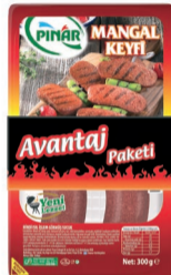
Mangal Keyfi 2 x 300 g