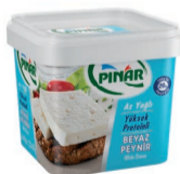
Beyaz Peynir Düşük Yağlı 400 g