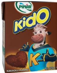
Kakaolu Puding 200 ml