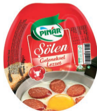
Şölen Sucuk 180 G TFE