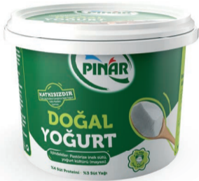
Kaymaksız Yoğurt 200 g