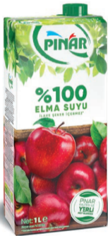
Meyve Suyu %100 Elma 1 L