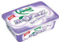
Pınar Beyaz Ekstra Yumuşak 180 g