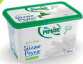
Süzme Peynir 1000 g