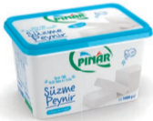
Süzme Peynir Yarım Yağlı 1000 g