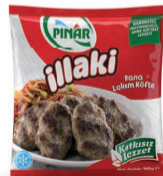
Lokum Köfte 395 g