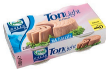
Light Ton Balık 2 x 160 g