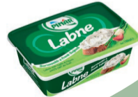
Labne Sarımsaklı & Frenk Soğanlı 180 g