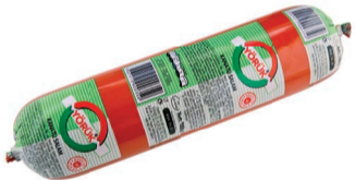
Yörük Salam 700 g