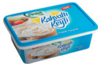
Kahvaltı Keyfi Taze Peynir 180 g TFE