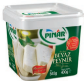
Beyaz Peynir Salamuralı 400 g