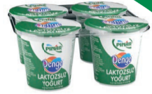
Denge Laktozsuz Yoğurt 4 x 125 g