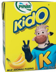
Muz Aromali Puding 200 ml