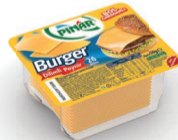
Burger Dilimli Peynir 350 g