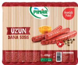
Ekonomik Sosis 430 g