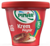
Krem Peynir 150 g