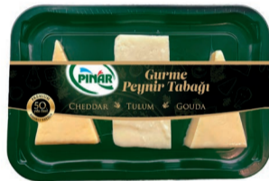
Gurme Peynir Tabağı 275 g