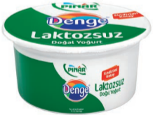
Denge Laktozsuz Yoğurt 750 g