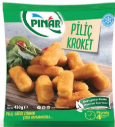
Piliç Kroket 430 g