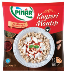
Kayseri Mantısı 400 g