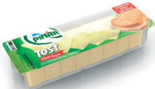
Dilimli Tost Peyniri 1,6 kg