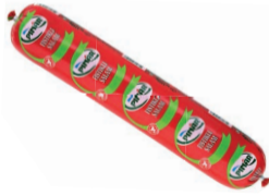
Fıstıklı Salam 1000 g