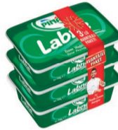
Labne 3 x 180 g (Avantajlı Paket)