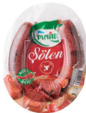
Şölen Acılı Kangal Sucuk 225 g