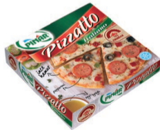
Pizzatto Italiano 365 g