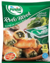
Labne-Ispanak Rulo Börek 500 g