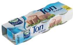
Ton Balık 3 x 80 g