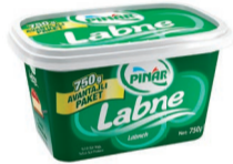
Labne 750 g