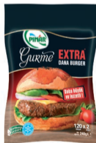
Gurme Extra Burger 240 g