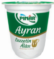
Lezzetin Alası Ayran 300 ml