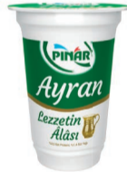
Lezzetin Alası Ayran 200 ml