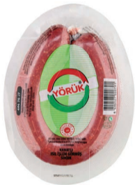
Yörük Kangal Sucuk 225 g