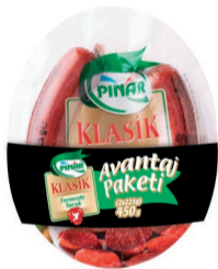
Klasik Kungul Sucuk 2 x 225 g