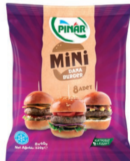
Pinar Mini Burger 320 g