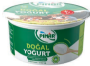
Doğal Yoğurt 750 g TFE