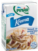
Yemek ve Soslara Özel Krema 200 ml