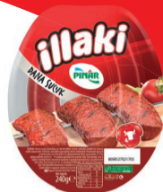
İllaki Sucuk 240 g