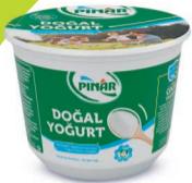
%1 Yağlı Yoğurt 1200 g TFE