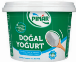
%1 Yağlı Yoğurt 2000 g