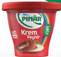
Krem Peynir 300 g TFE