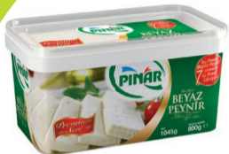
Beyaz Peynir Salamuralı 800 g