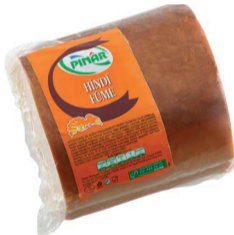
Hindi Göğüs Füme