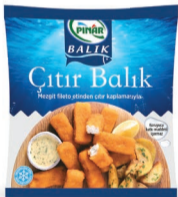
Çıtır Balık 400 g