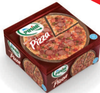
Karışık Pizza 600 g