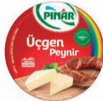
Üçgen Peynir 8 x 12,5 g