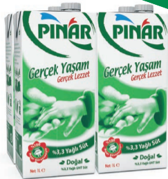
Tam Yağlı Süt 4 x 1 L