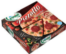
Pizzatto Alaturka 365 g