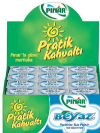
Pınar Beyaz 20 g (36'lı)