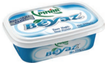
Pınar Beyaz 350 g