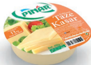
Taze Kaşar 400 g