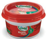
Krem Peynir 100 g TFE