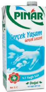
%1 Yađlı Süt 1 L (TFE)