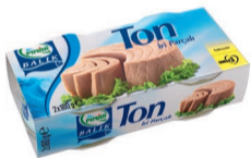
Ton Balık 2 x 160 g