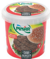
Pinar Burger 545 g