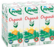
Organik Süt 6 x 200 ml