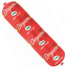
Doyum Hindi Salam 700 g