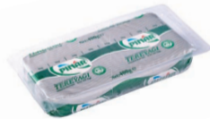
Folyo Tereyağı 400 g