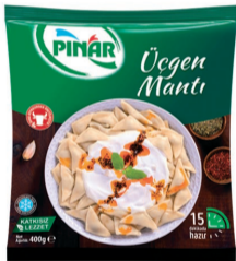
Üçgen Manti 400 g