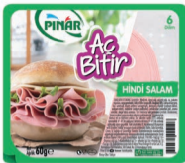
Aç Bitir Büyük Dilim Hindi Salam 60 g