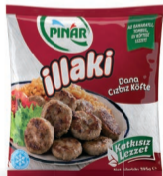
Cızbiz Köfte 395 g