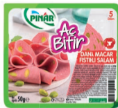
Aç Bitir Büyük Dilim Fıstıklı Macar Salam 50 g