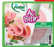
Aç Bitir Büyük Dilim Fıstıklı Hindi Salam 50 g