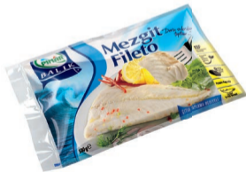
Mezgit Fileto 500 g