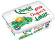
Organik Labne 180 g