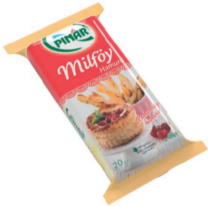
Milföy 1000 g