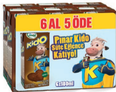
Kido Kakaolu Süt 6 x 180 ml 6 al 5 öde