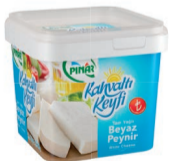
Kahvaltı Keyfi Beyaz Peynir 400 g TFE