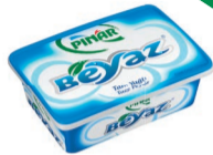
Pınar Beyaz 180 g TFE